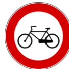
DIVIETO DI TRANSITO ALLE BICILETTE